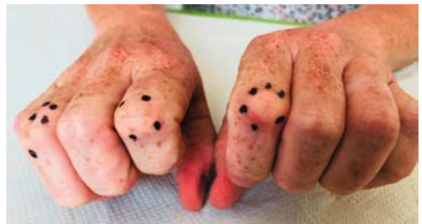
Abbildung 4 _Schmerzhafte Knuckle Pads (Garrod's nodules)

Schmerzreduktion kann auch beim Morbus Ledderhose des Fußes in gleicher Weise mit der fokussierten hochenergetischen ESWT belegt werden [17] wie auch bei schmerzhaften Knuckle Pads (→ Abb. 4) [18, 19].