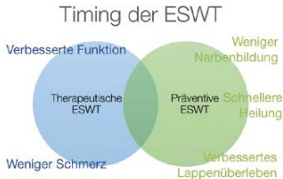
Abbildung 2. Konzept der therapeutischen und präventiven ESWT nach Knobloch. Timing der ESWT als therapeutische ESWT nach Eintreten einer Erkrankung/Verletzung mit verbesserter Funktion und zum Beispiel weniger Schmerz gegenüber der präventiven ESWT etwa vor chirurgischen Narben/Spalthautentnahme zur beschleunigten Heilung mit weniger Narben bzw. zur Präkonditionierung von Lappenplastiken.

Kahnbeinpseudarthrosen stellen auch eine gut belegte Indikation zur ESWT insbesondere für hochenergetische fokussierte Technologien dar [7]. Eine aktuelle randomisiert-kontrollierte Studie [8] von Februar 2018 prüfte bei 58 Patienten mit Daumensattelgelenksarthrose (Rhizarthrose) die fokussierte ESWT ( 3 \times 0,09 \text{ mJ/mm}^2 , 4 Hz, 2400 Impulse) im Vergleich zur dreimaligen intraartikulären Hyaluronsäure-Injektion. In beiden Gruppen zeigten sich eine Verbesserung des Schmer-