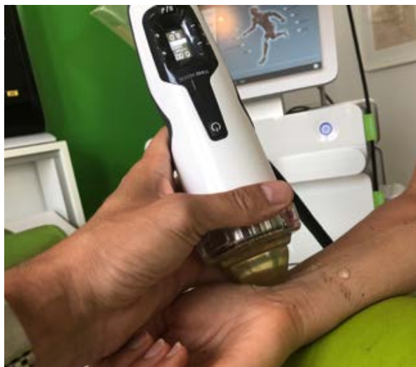
Abbildung 5 Fokussierte niedrigenergetisch elektromagnetische Stoßwellentherapie beim Karpaltunnelsyndrom.